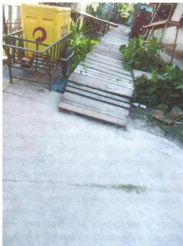
IMAGEM 2- PIER DE ACESSO ÀS RESIDENCIAS